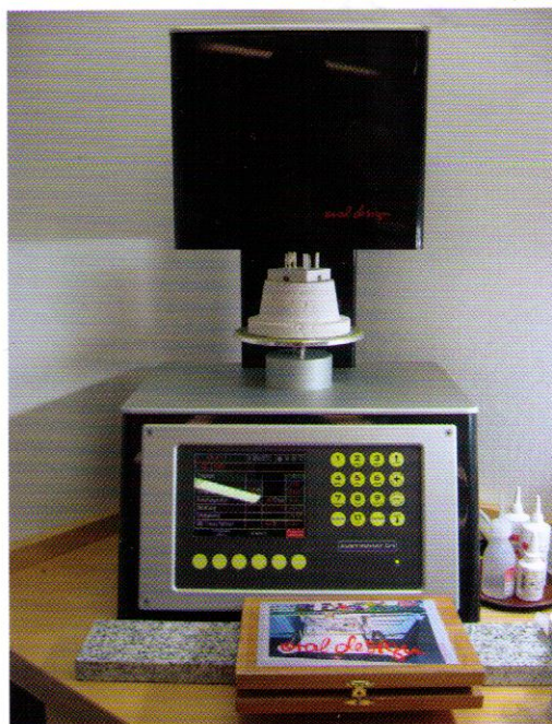
Abb. 6 „Heilbrand“