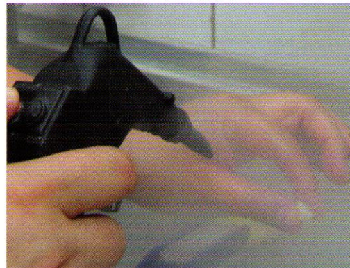
Abb. 3 Reinigen