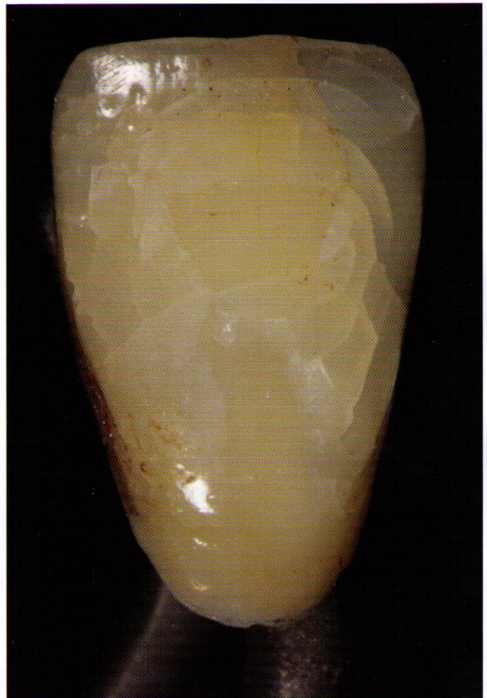
Abb. 1 Unser Test: Ausgangssituation nach thermischer Manipulation

Mit großer Sorgfalt haben wir zunächst die Untersuchung des Centrum für Zahnmedizin CC3 der Charité Universitätsmedizin Berlin über die Wirksamkeit der Denseo Fee studiert. In der Abhandlung zum Ergebnis steht: „... Es waren keine Haarrisse mit bloßem Auge zu erkennen, auch nicht mit dem Mikroskop, ebenfalls in rasterelektronischer Untersuchung konnte die Nahtstelle nicht gefunden werden.“ Das heißt zusammengefasst, dass man Risse im keramischen Material mit Denseo Fee heilen kann. Wir verfügen über keine Zwick