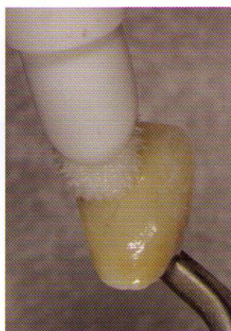
Abb. 5 Auftragen des Denseo-Materials