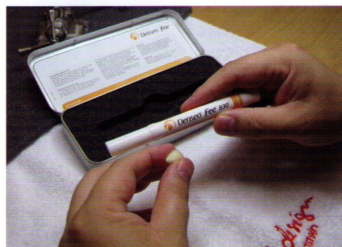
Abb. 4 Denseo-Set

Wir waren sehr überrascht von diesem Ergebnis, denn dieser extreme Versuch mit