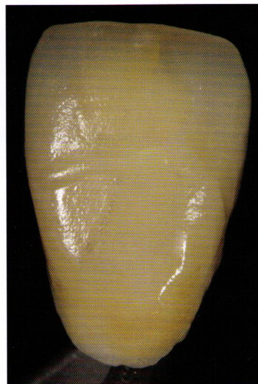
Abb. 7 Endergebnis