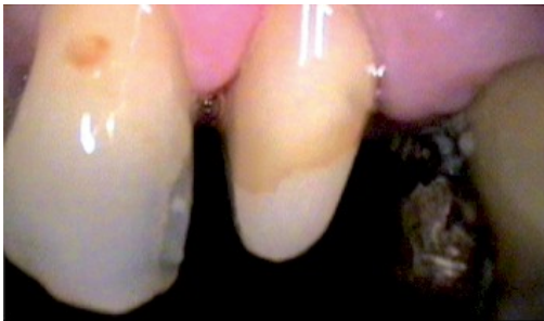
Figura 3. Reconstrucción y tallado del 24