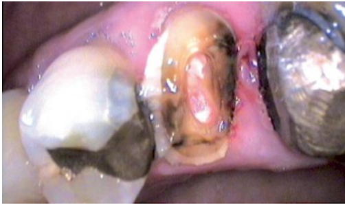
Figura 1. 24 endodonciado, fractura con gran destrucción de corona.