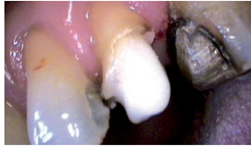
Figura 2. En proceso de reconstrucción con el sistema Core & Post de Dentsply