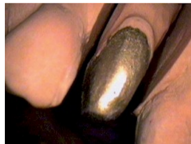
Figura 6. Detalle preparación modelo de laboratorio.